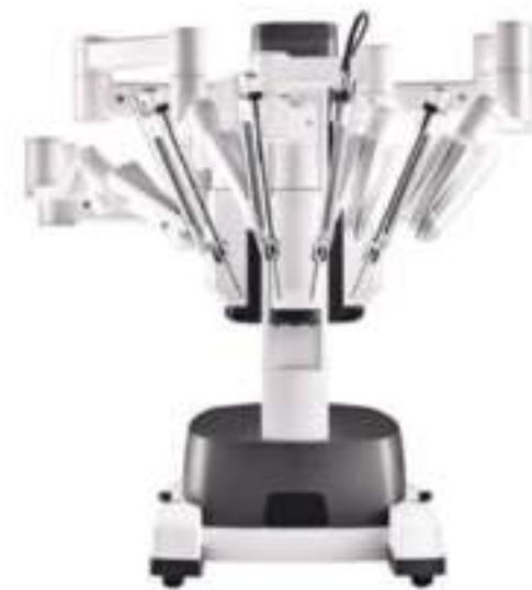
Mit dem „daVinci-Roboter“ wurden weltweit bereits sechs Millionen Operationen durchgeführt. Offene Operationen werden durch die neuen Möglichkeiten immer seltener.

Während der Operation kann Romero so die Idealpositionierung und die individuellen Gegebenheiten des Patienten berücksichtigen. „Es werden nicht nur wie bei der 3-D-Prothese die Knochenverhältnisse, sondern auch die Weichteilspannung berücksichtigt“, sagt der Facharzt. „Das Ziel der Knie-Endoprothetik ist es, dass jeder Patient zu einem neuen Knie kommt, das er nicht als fremd empfindet, eine gute Stabilität vermittelt, eine volle Beweglichkeit aufweist und absolut schmerzfrei ist.“