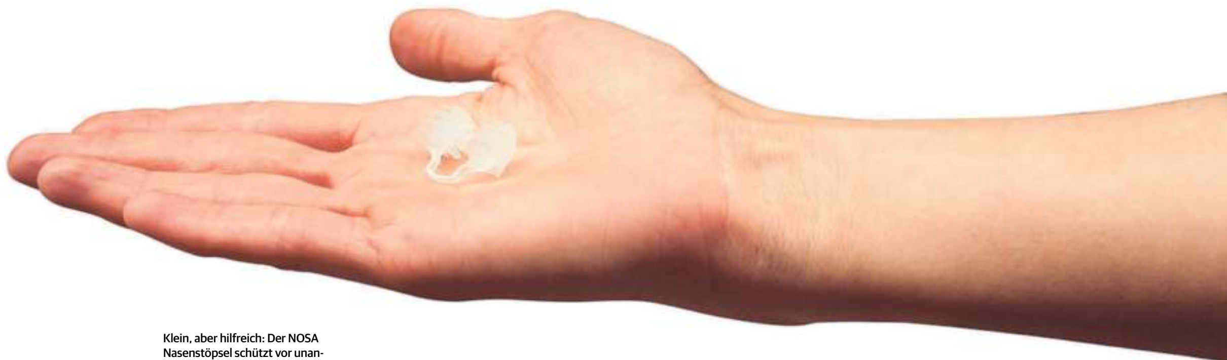
Klein, aber hilfreich: Der NOSA Nasenstöpsel schützt vor unangenehmen Gerüchen.