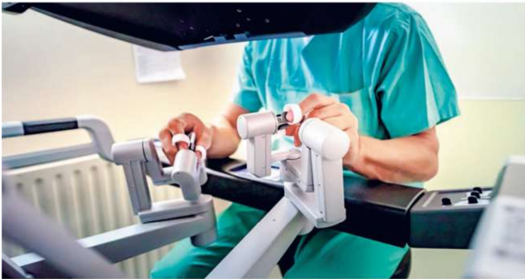
Die Roboter ermöglichen es den Ärzten, Operationen sehr präzise und ohne große Schnitte durchzuführen.

Der Mediziner ist sich sicher: „In fünf bis zehn Jahren wird es keine offenen, großen