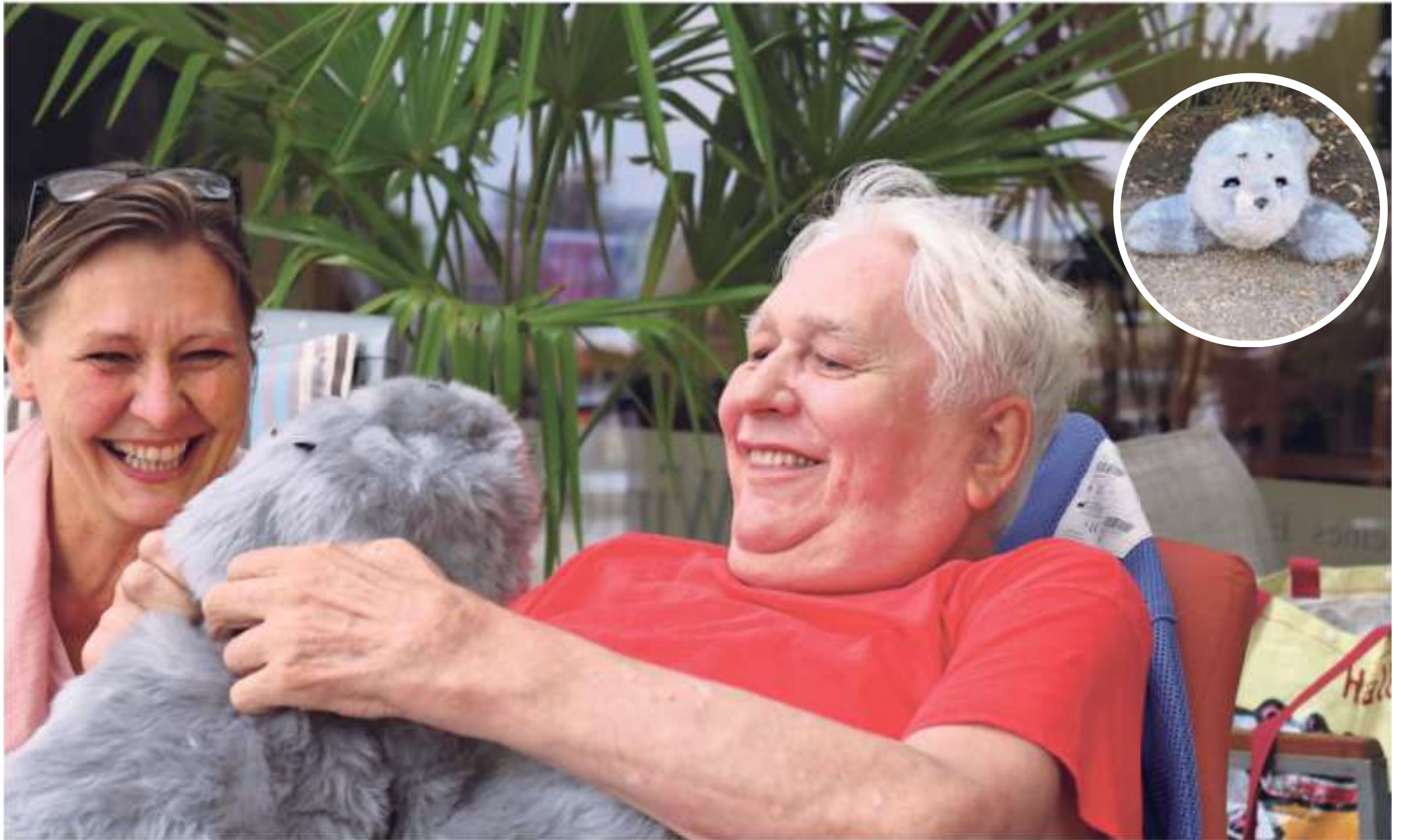
Die Roboter-Robben erfreuen sich bei den Bewohnern der Kölner AWO Seniorenzentren Arnold-Overzier-Haus und Theo-Burauen-Haus großer Beliebtheit.

„Bei einigen Mitgliedern der Fördervereine gab es Ängste,