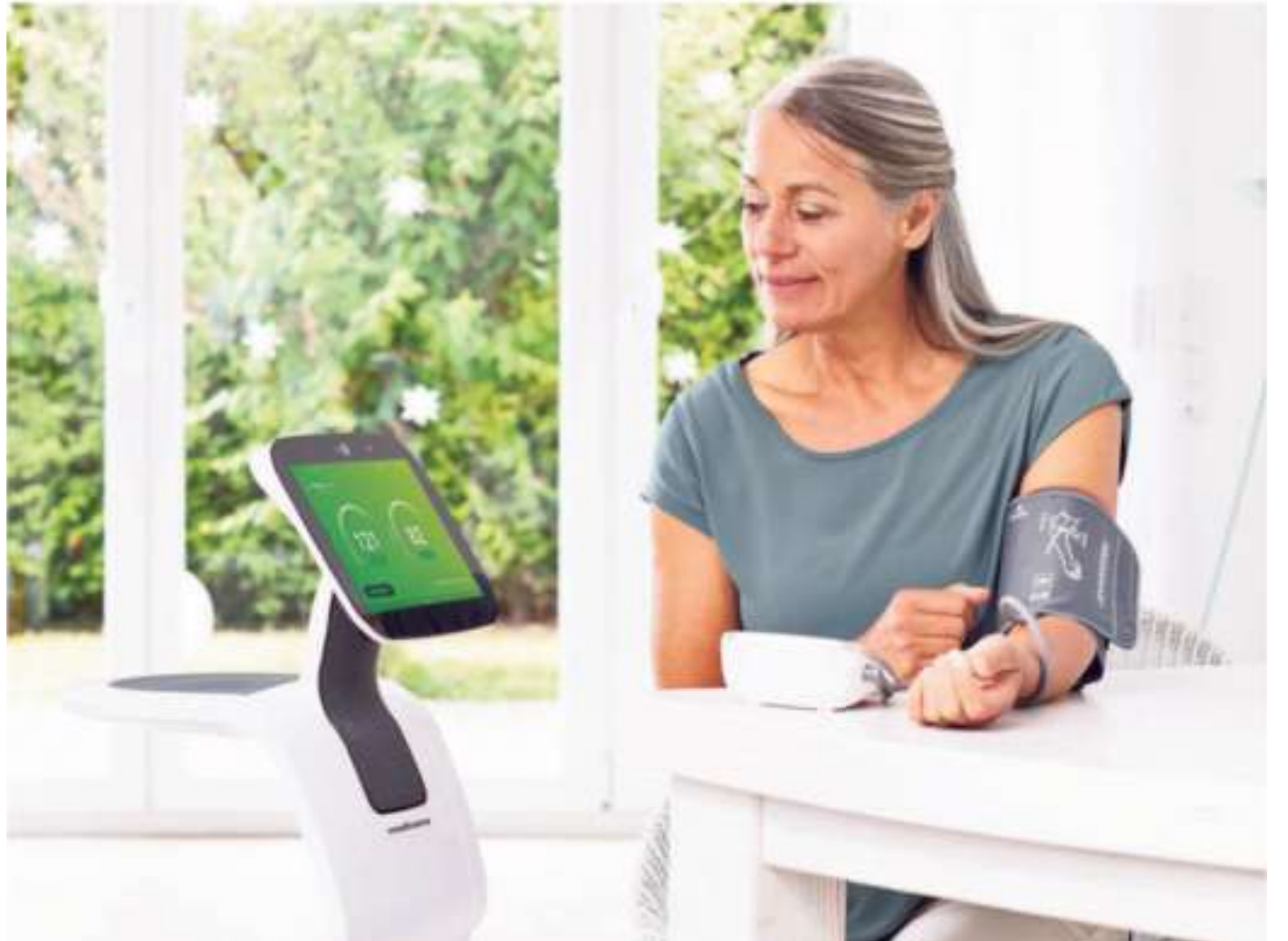
Der Home-Care-Roboter von medisana kann medizinische Daten sammeln, den Benutzer unterhalten und dient der Kommunikation mit Freunden, Familie oder auch Ärzten.

Das Gerät für das sogenannte Ambient Assisted Living (ALL) soll aber auch der Vereinsamung im Alter entgegenwirken. Über Alexa steht per Sprachsteuerung ein breites Entertainment-Angebot zur Verfügung. „Wir haben bei der Entwicklung den Schwerpunkt auf die vier Bereiche Sicherheit, Kommunikation, Unterhaltung und Gesundheit ge-