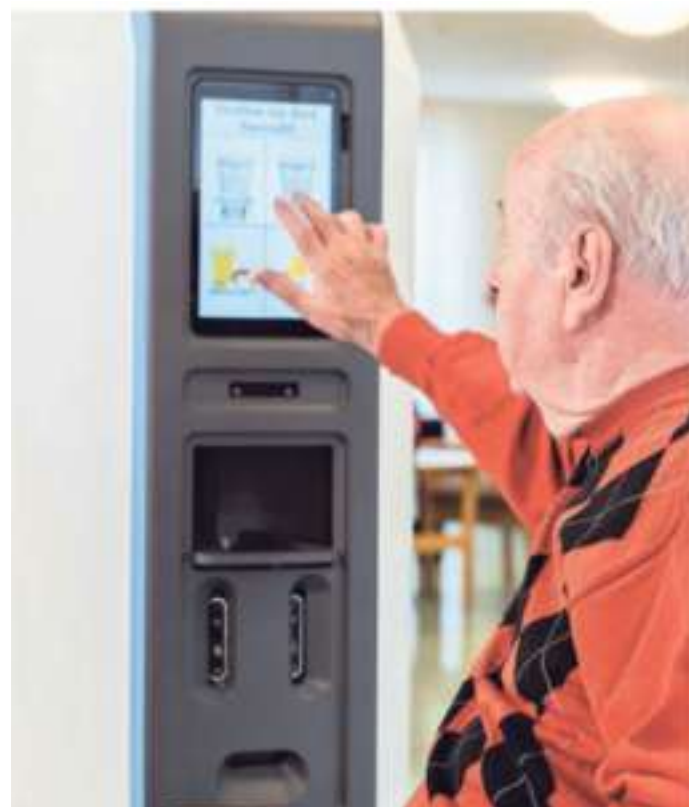
Im Seniorenzentrum Waldhof wurden sowohl der Pflegewagen (Bild links) als auch der Getränkeassistent Praxistests unterzogen.