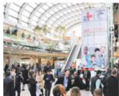
Auf der MEDICA werden rund 120.000 Fachbesucher erwartet.