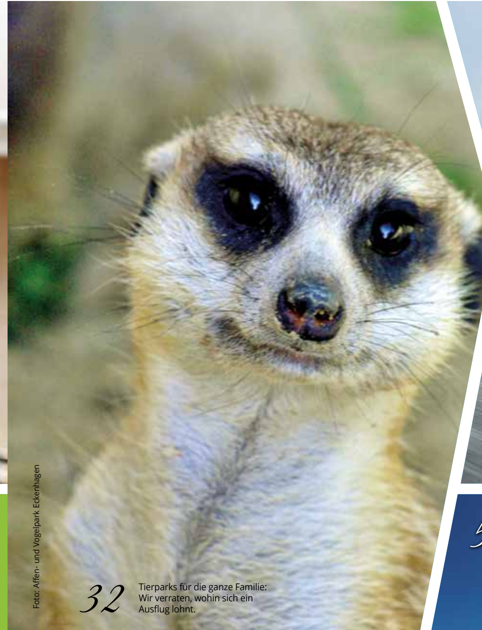
32 Tierparks für die ganze Familie: Wir verraten, wohin sich ein Ausflug lohnt.