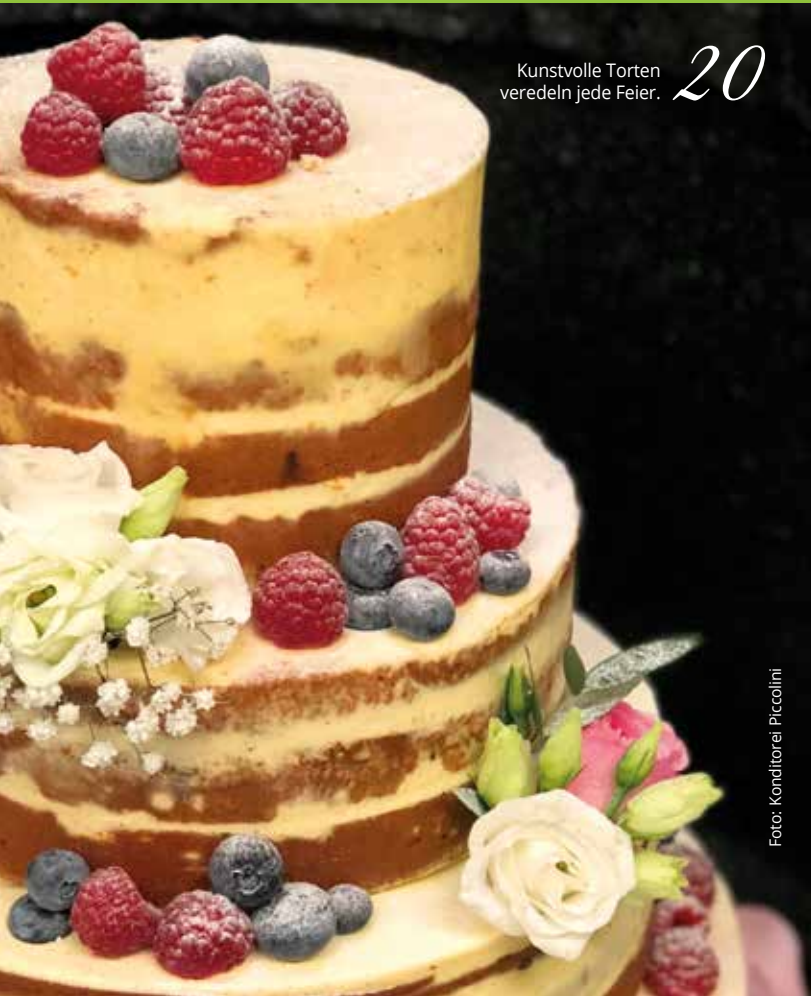
Kunstvolle Torten veredeln jede Feier. 20