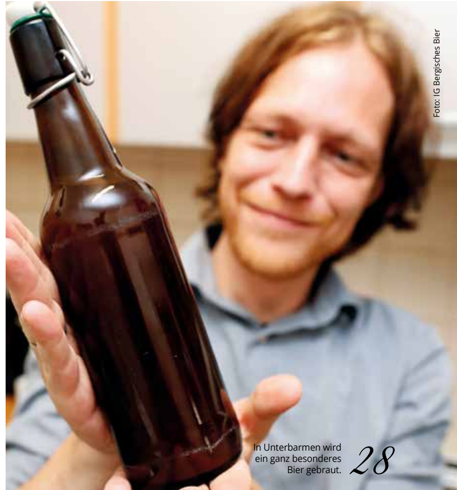
In Unterbarmen wird ein ganz besonderes Bier gebraut. 28