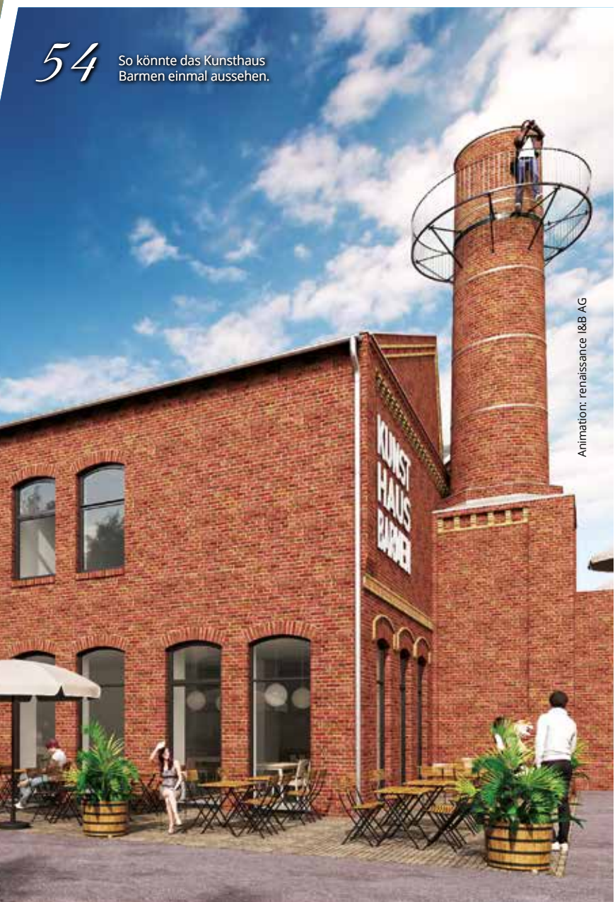
54 So könnte das Kunsthaus Barmen einmal aussehen.