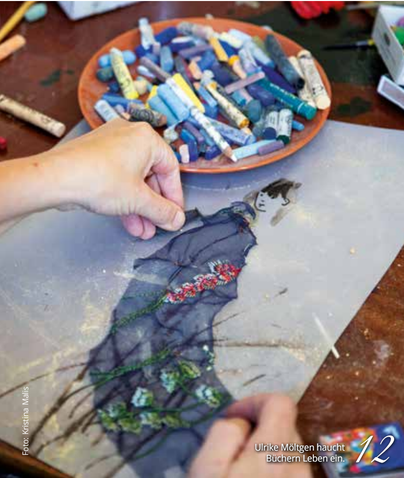
Ulrike Möltgen haucht Büchern Leben ein. 12